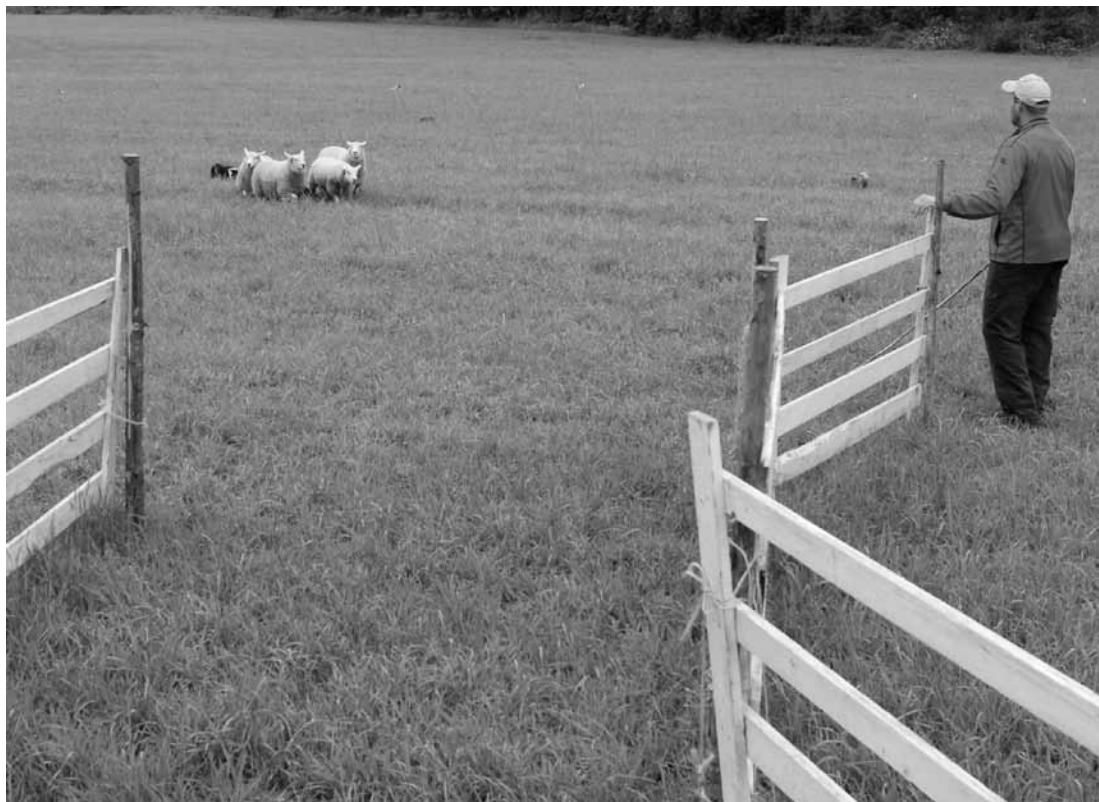
Perusratahäkin portilla ei ole narua, vaan ohjaaja pitää kiinni portista.

paljon, ovat ne sen jälkeen huomattavasti vaikeammat saada menemään sisälle 2m leveästä porttiaukosta. Perusratahäkin portissa ei ole köyttä, kuten kisaikäinportissa. Ohjaaja siis pitää kiinni portista koko ajan. Koiran tehtävä on ajaa eläimet häkkiin. Ohjaajan avusta harvemmin on haittaakaan. Eläimet ajetaan häkin sisäpuolelle ja koira ohjataan häkin sisälle etuosaan ennen portin sulkemista. Koira pysäytetään ja tuomari antaa luvan ohjata koira lauman taakse. Koiran tulee liikkua häkissä rauhallisesti ja kiertää varmaotteisesti eläinten taakse. Koira siirtää eläimet häkin suuaukolle. Ohjaaja avaa portin ja koira painostaa eläimet pois häkistä.