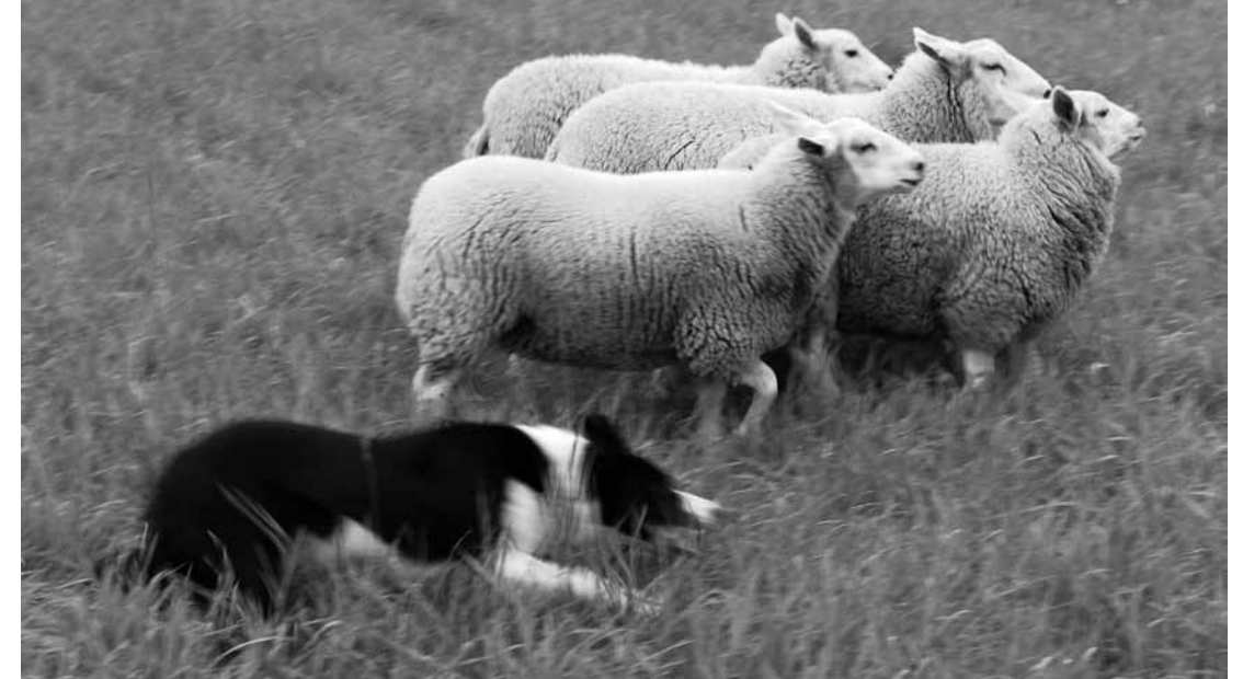
Perusradassa mitataan myös koiran kykyä pitää laumaa kasassa. Jill työssä.

taa, että jokaisesta kohdasta on keskimäärin pitänyt saada 3-5 pistettä, että kohdista E, F ja G saa myös samansuuntaisia pisteitä.