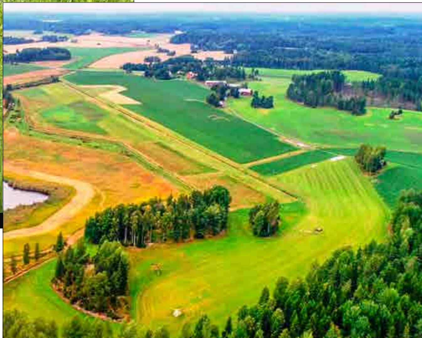
Tävlingsåker i Skarsböle.