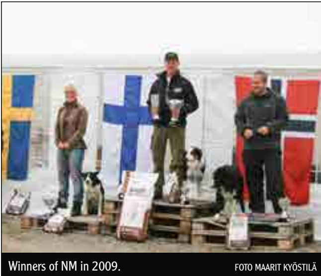
Winners of NM in 2009.