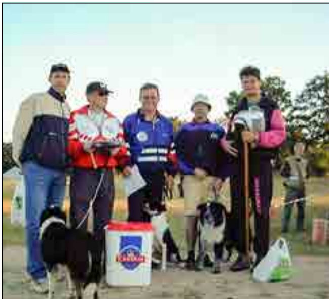
Ravlunda 2001 finalists.