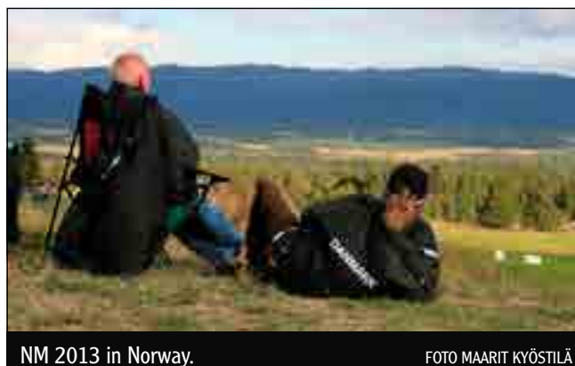
NM 2013 in Norway.

2013 Norway , 24-25 August (Continental 30 August-1 September, Belgium)